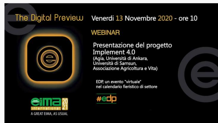
Presentazione progetto Implement 4.0 (italiano)

ITALIANO https://www.youtube.com/watch?v=pmA1ci4oLCK