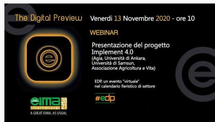
Presentazione progetto Implement 4.0 (italiano)

ITALIANO (Intervento Presidente Francia) https://www.youtube.com/watch?v=dBn_sL-KE3k