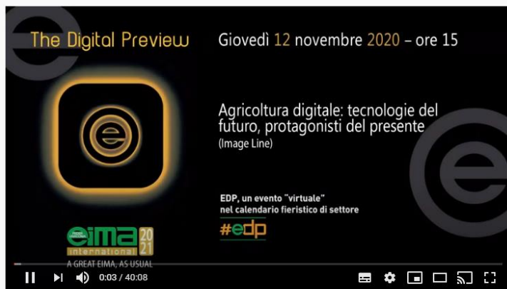
Agricoltura digitale: tecnologie del futuro, protagonisti del presente - Image Line

ITALIANO (Intervento Presidente Francia) https://www.youtube.com/watch?v=dBn_sL-KE3k